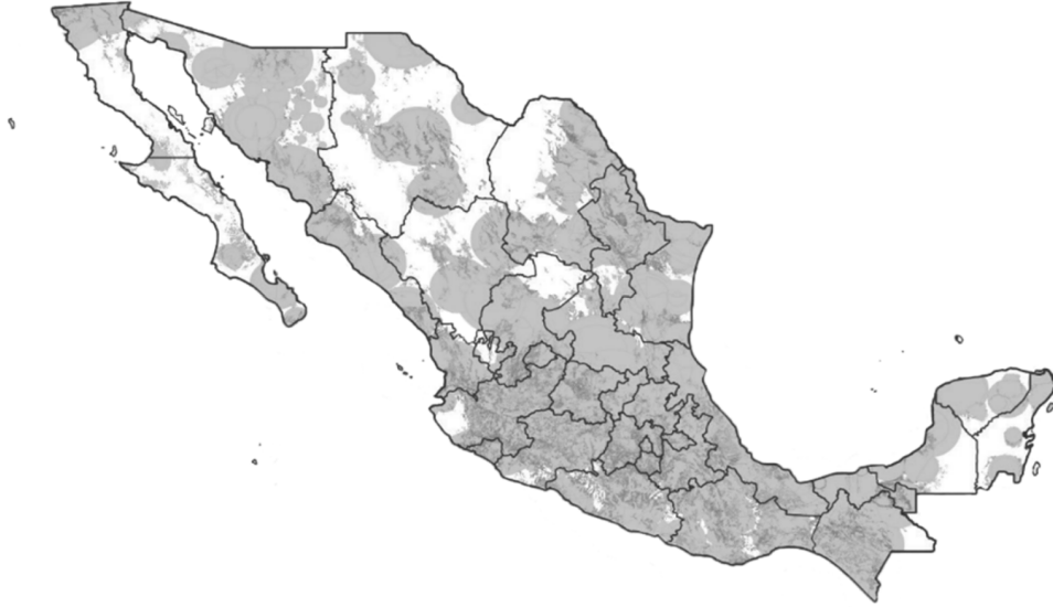
Figura 1. Gráfico de las zonas de cobertura y áreas de servicio de las estaciones de televisión radiodifundida y equipos complementarios respectivos autorizados en México.

La Figura 1 siguiente muestra gráficamente estas zonas de cobertura y áreas de servicio del país.