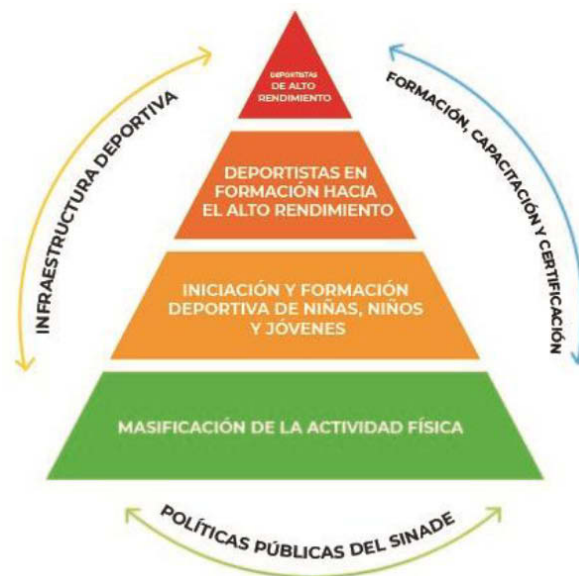
Figura 1. Estructura piramidal del desarrollo de la cultura física y el deporte

La construcción de una cultura física sólida y en constante desarrollo y un deporte de calidad, desde los ámbitos de promoción hasta los altos niveles competitivos, requieren del esfuerzo permanente del gobierno federal, de las entidades federativas, de los ayuntamientos, de las asociaciones deportivas nacionales (ADN), de las instituciones académicas de los tres niveles educativos y, en general, de los distintos sectores de la sociedad mexicana.