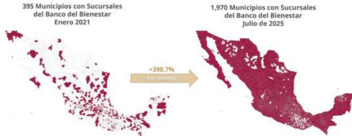
Figura 1. Incremento en la Cobertura Municipal con Sucursales del Banco del Bienestar.