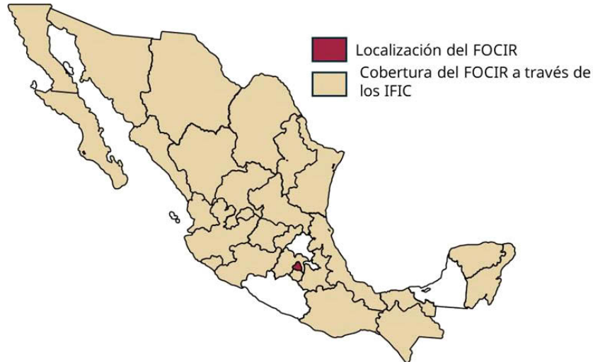
Ilustración 1 Zona de Impacto del FOCIR