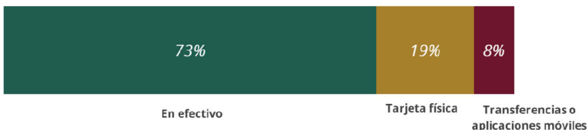
Figura 3. Medios de pago para realizar compras mayores a 500 pesos.

Fuente: Elaborado por el Banco del Bienestar con información de la ENIF 2024.